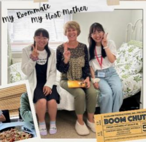
My Roommate My Host Mother