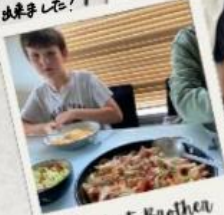
My Host Brother