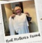
Host Mother's friend