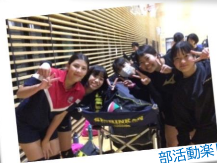
部活動楽しかったね