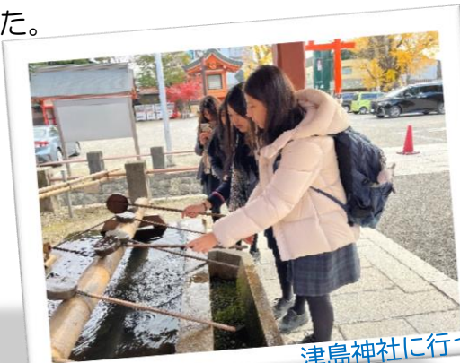
津島神社に行ってきたよ

学校でいろんなじゅぎょうをとれてたのしかったけどいちばんたのしいのはかていかでした。クラスメートとおやこどんをつくることができるとてもおいしかったです。学校はおもしろかったけど、さいしょはあさ早くおきることはちょっとむずかしかったです。そして、日本はオーストラリアよりとてもさむいです！おどろきました！みんなとてもやさしくて、えいごがしょうずだったから、たくさんあたらしい友だちができてうれしかった！ぶかつもはいれて、たくさんバレーボールをできました。バレーぶのみんながいっしょうけんめいれんしゅうしていたのにかんどうしました。