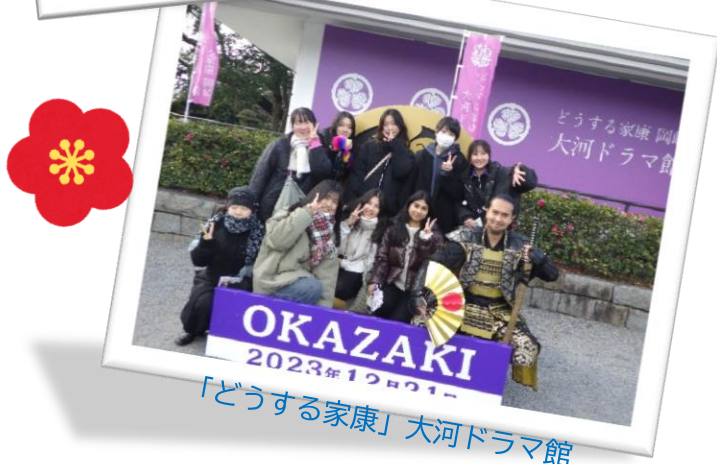
「どうする家康」大河ドラマ館

清林館高校でとてもいい思い出をたくさん作ってしあわせな時間でした。初めて学校に来た時に、とてもきんちょうして自己紹介する時がいちばんしんぱいしました。昼休みと英語の授業と体育が一番たのしかったです。でも古典はむずかしくてなにもわからなかったです。持久走が一番たいへんでみんなとてもきらいな時間でした。日本で買い物をしてかわいいものをたくさん買いました。オーストラリアに帰った後で日本の友達に一番会いたくなくと思います。私の人生でわすれられない思い出をたくさん作りしました。清林館高校はとてもたのしい学校です。