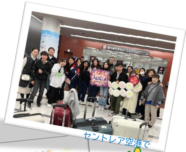
セントレア空港で