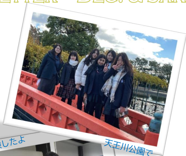
浮世絵体験したよ

たくさんのすばらしいおもいでをつくりました。さいしょは学校はこわくてむずかしかったです。でもたくさん友だちをつくることができました。みなさんはとてもやさしくてしんせつでした。あたらしい友だちといっしょにひるごはん食べるのをたのしみました。えんそくでつしまに行きました。えんそくですとう先生とさかた先生が日本のれきしをおしえていました。だから、えんそくはとてもおもしろかったです。そして、日本のクラスはわかるのがたいへんでした。学生がよるおそくまでべんきょうしていることにおどろきました！みんなとてもべんきょうねっしんでかんだうしました。