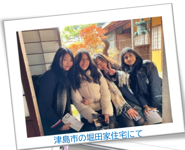
津島市の堀田家住宅にて